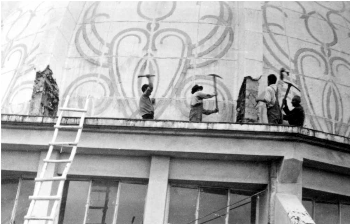
Demolición del Centro Nacional Bahá'í en Teherán, Irán, en torno a 1955.

inmutable de Dios, eterna en el pasado y eterna en el futuro”.