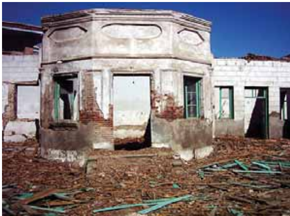
En abril de 2004, en Babol, se destruía la tumba de Quddús, figura histórica de la Fe bahá'í.