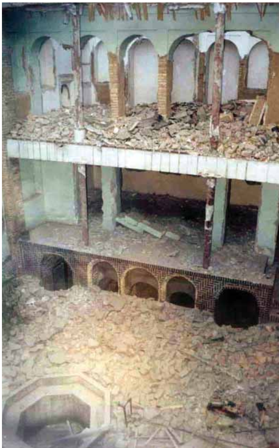
En junio de 2004, se destruía también la casa del padre de Bahá'u'lláh, Mirzá Abbás Núrí, pese a ser un ejemplo atesorado de arquitectura islamo-iraní.

Con los años, tanto en Teherán como en otras ciudades de todo el país, los edificios bahá'ís sufrieron saqueo e incendios, se arrasaron los cementerios bahá'ís y se abrieron las tumbas. En la zona de Teherán, se forzó a los bahá'ís a enterrar a sus muertos en un terreno baldío reservado por las autoridades para los "infieles". Disponer de un lugar de entierro es especialmente importante para los bahá'ís puesto que, como cabe suponer, no se les permite enterrar a sus muertos en los cementerios musulmanes.